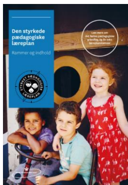
Den styrkede pædagogiske læreplan. Rammer og indhold

Inden for de krav, der følger af dagtilbudsloven, er det op til jer at beslutte, hvordan I konkret vil arbejde med den pædagogiske læreplan. Jeres læreplan skal være et dynamisk og meningsfuldt dokument, som peger fremad, og som I kan bruge aktivt i den løbende udvikling af den pædagogiske kvalitet og jeres pædagogiske praksis.